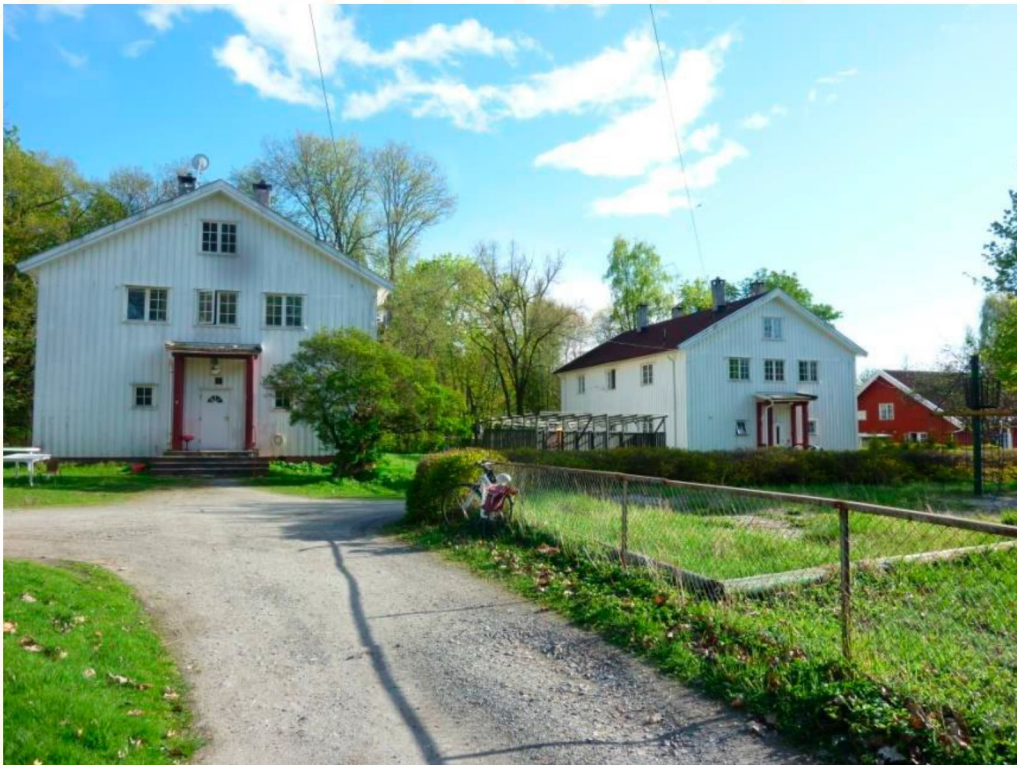
Kaserner i Ormsund leir.

Med hjemmel i lov om kulturminner av 9. juni 1978 nr. 50 § 15 jf. § 22, freder Riksantikvaren Ormsund leir, gnr./bnr. 197/13, 9 og 324, i Oslo kommune.