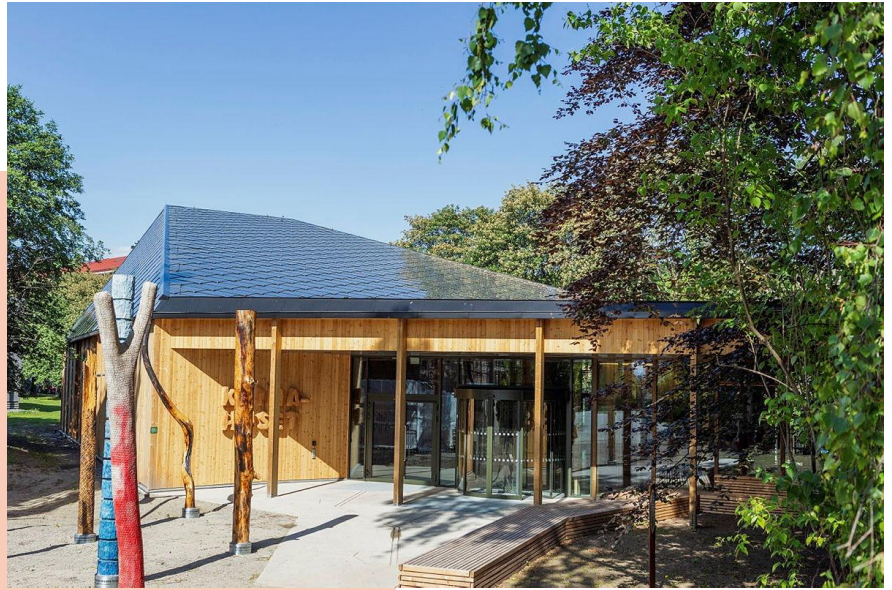
Klimahuset på Tøyen