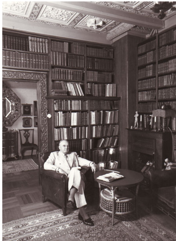
Harry fett (1875-1962) ble utnevnt til riksantikvar i 1913. han etterfulgte arkitekt Herman Major Schirmer som bare hadde stillingen i 5 måneder. Harry Fett var Riksantikvar i hele 33 år, fra 1913 til 1946.

Riksantikvaren ble et offentlig embete under Kirke- og undervisningsdepartementet i 1912. Institusjonen overtok oppgavene som direksjonen i Foreningen til norske Fortidsminnesmerkers bevaring til da hadde