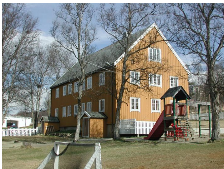
Fasade sørvest