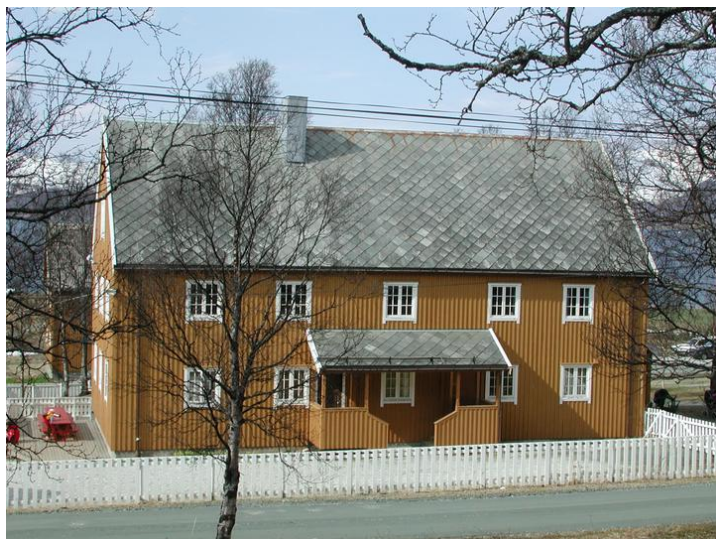
Fasde aust