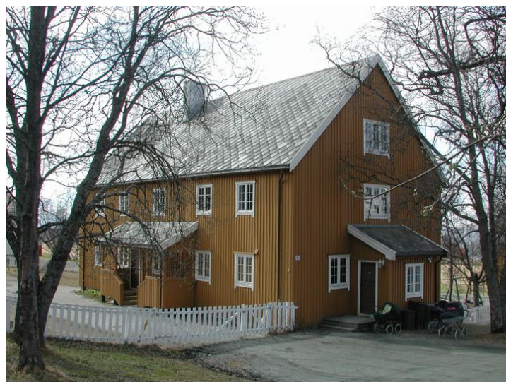
Fasade nordaust