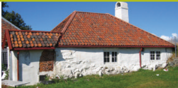
Falkeskjoldsmessen på Munkholmen.