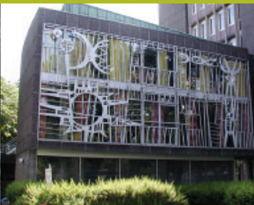
Rikstrugdeverket Oslo