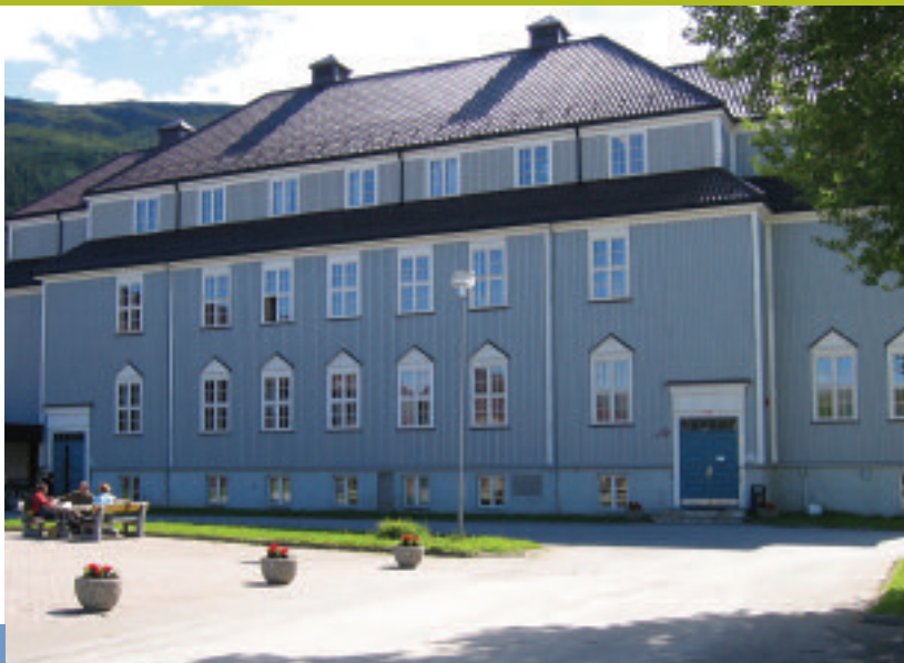
Høgskolen i Nesna.