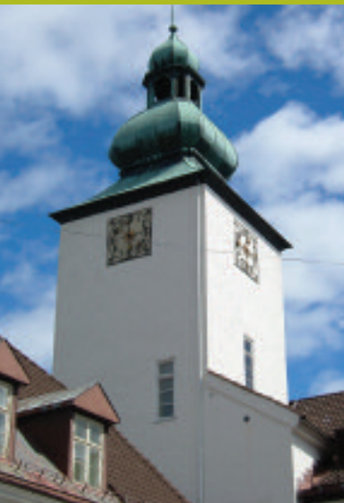
Tårnet ved Bærum Sykehus.