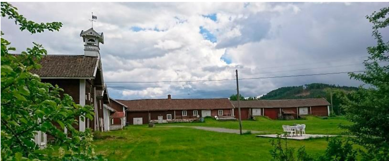
Uthusene på Vest-Nor

Vest-Nor gård, gnr./bnr.: 101/2 i Kongsvinger kommune Vedtak om fredning med hjemmel i lov om kulturminner § 15 og § 19 jf. § 22