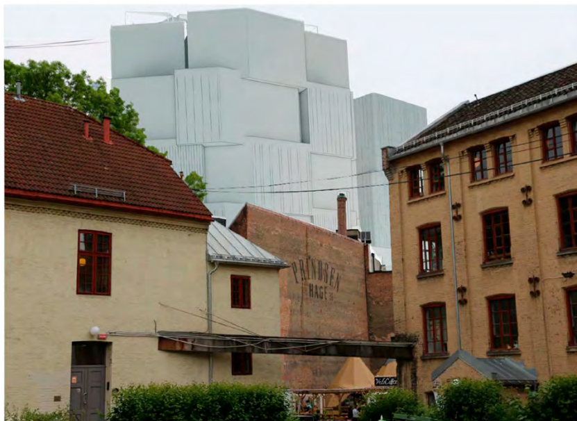
25. Prindsens Hage bakgård

Lilletorget 1 er en plasstøpt betongbygning i opprinnelig åtte etasjer med et forholdsvis stort fotavtrykk. Bygningen representerer derfor et stort forbruk av ressurser, som i sin tid satte et klart klimaavtrykk. Å rive bygningen for så å bygge noe helt nytt vil bidra til ytterligere klimagassutslipp. Regjeringen har ved gjentatte anledninger påpekt viktigheten av ombruk og transformasjon av eldre bygningsmasse, som et bidrag til å redusere klimagassutslipp. Eksisterende bygninger har tatt «klimagassregningen». ICOMOS har også i sin rapport The Future of Our Past (2019) vektlagt at ombruk av eldre bygninger kan være et viktig tiltak for å redusere klimagassutslippene. Dette er også i tråd med Riksantikvarens klimastrategi for kulturmiljøforvaltning (2021).