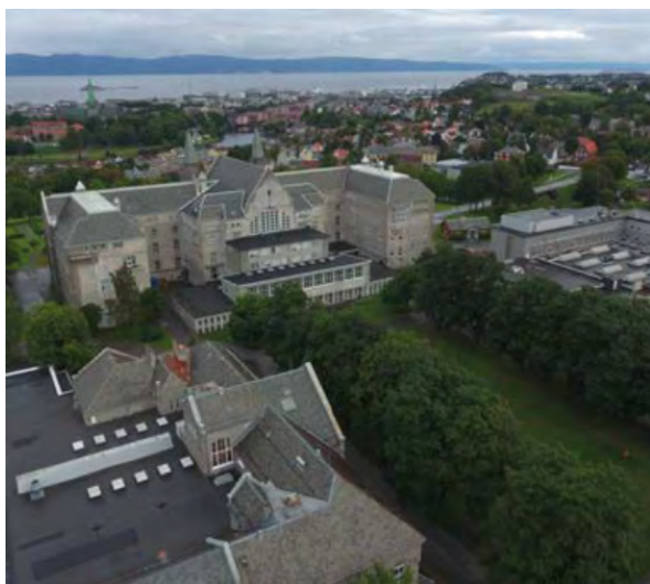
Situasjon 2017, foto: Andre Hope

reguleringssaken åpner for. Samlet sett er dette endringer som overskrider hva det kan gis dispensasjon for etter kulturminneloven.