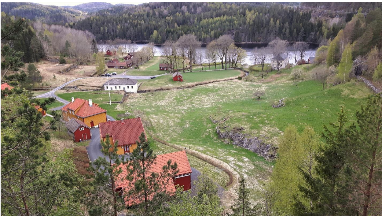
Fredningsområdet sett fra øst.

Vi viser til tidligere utsendt fredningsforslag for Eikelands verk datert 21.6.2016 som har vært på høring hos berørte parter og instanser. På grunnlag av dette og innkomne høringsuttalelser fatter Riksantikvaren følgende vedtak: